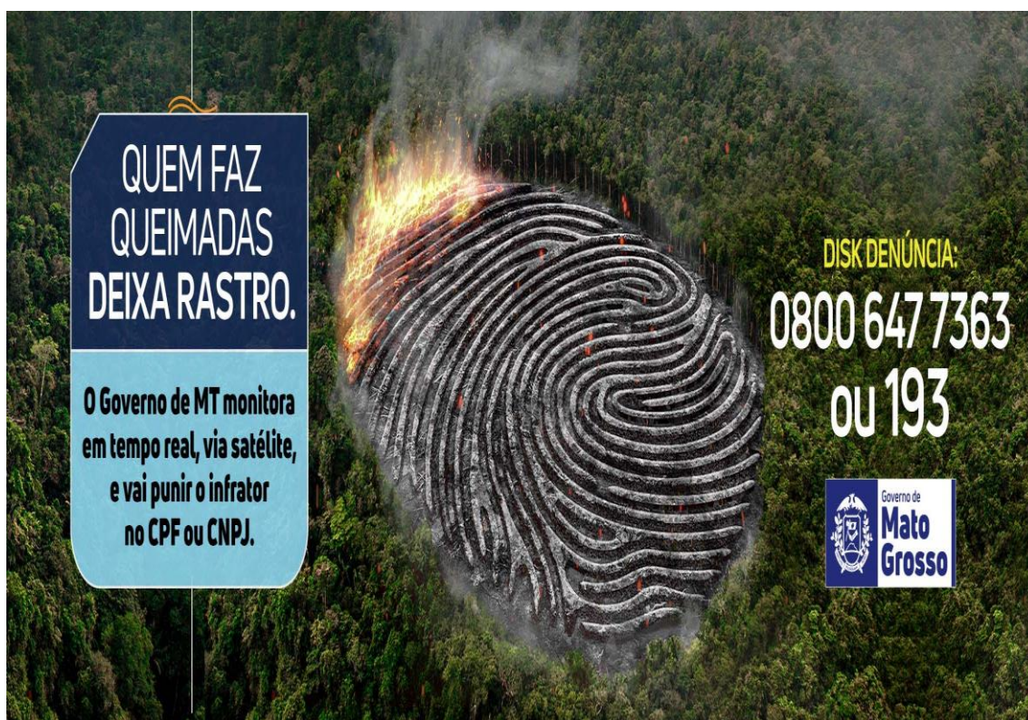
Figura 3 – Outdoor (SECOM)