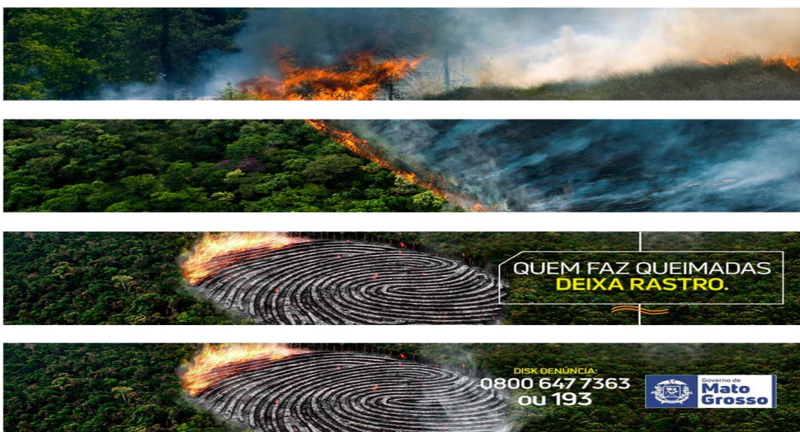
FIGURA 2 – BANNER QUEIMADAS (SECOM)